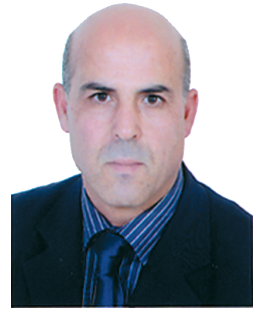
بقلم جمال بختي، م.س.ت.

ينطلق من فرضيات مرقمة ويرتكز على مجموعة من الصيغ الرياضية التي ترسم سلوك مختلف المتعاملين الاقتصاديين، لإنتاج صورة واقعية لتطورات أهم المتغيرات الاقتصادية، ويتميز هذا النموذج بالخصائص التالية: